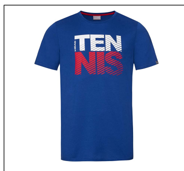
CAMISETA NO REGLAMENTARIA