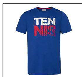
CAMISETA NON REGULAMENTARIA